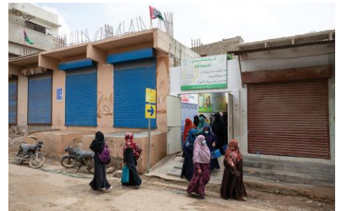
女性保健員は、男性の保健員が入れないような家にも入ることができます。