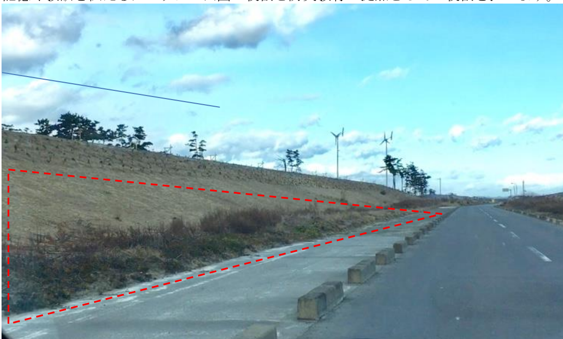
今回植樹場所：赤点線の法面（全長 330m，法高 5m）

岩沼市では震災により生じたガレキを再生活用し沿岸部一帯に 15 基の丘陵地を造成する「千年希望の丘」を整備しています。丘と丘はかさ上げた園路で結び、法面に植樹を行います。震災の記憶や教訓を伝えるメモリアル公園の役割と防災教育の拠点としての役割を担います。